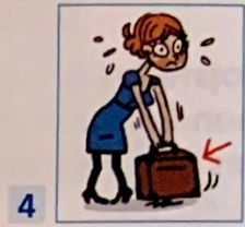
une valise ...