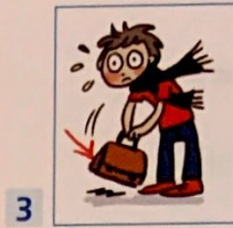
un cartable ...